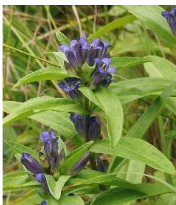
Szent László füve:

forrás: http://magyarnyelv.network.hu/blog/magyar-nyelv-hirei/mondak-legendak-szent-laszlo-kiralyrol