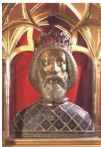
A Szent László herma