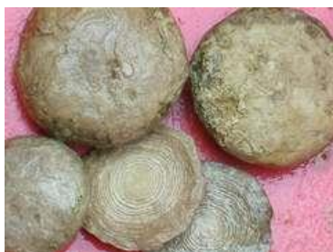
Szent László pénze: