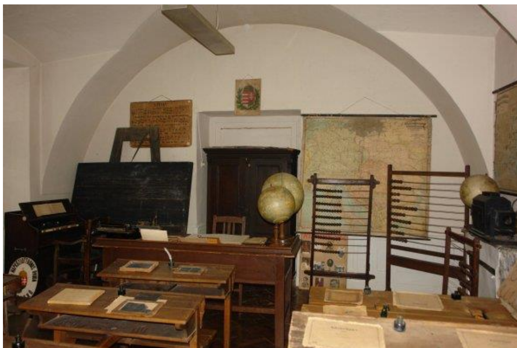
Taneszközök és berendezési tárgyak az iskolatörténeti kiállításban Szendrőn, a Csáky-kastélyban